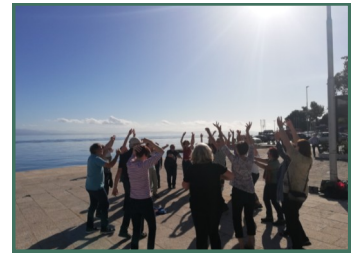
Die Tänze am Meer sind unvergesslich

Tanzen! Zur Mitte kommen. Tiefe und Leichtigkeit erleben. Tanzen! Spiritualität und Gebet in Bewegung. Tanzen! Das Leben tanzen in Kreistänzen verschiedener Kulturen. Tanzen, ruhig und auch mal schwungvoll! Erleben Sie die Freude des Augenblicks in tragender Gemeinschaft! Wir werden uns täglich ca. drei bis vier Stunden tanzend in unsere Mitte einschwingen. Darüber hinaus bieten wir Ihnen auch Morgenimpulse, Qi Gong und fakultativ Ausflüge an. Vorkenntnisse sind nicht erforderlich.